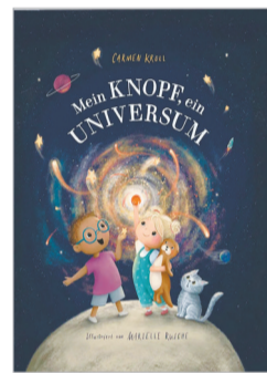
《我的纽扣，一个宇宙》